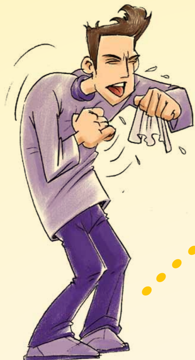
TUSE CU SPUTĂ mai mult de 3 săptămâni