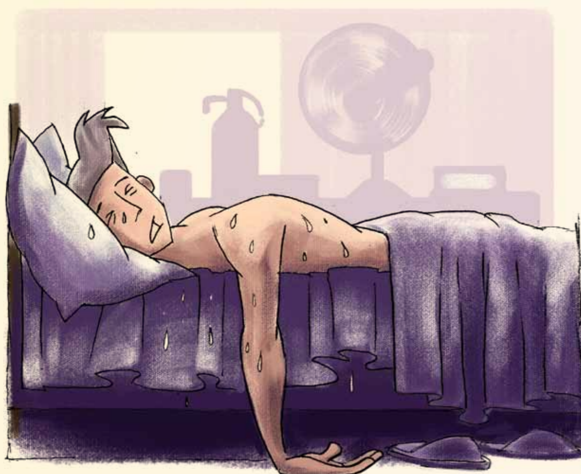
TRANSPIRAȚII EXCESIVE mai ales noaptea