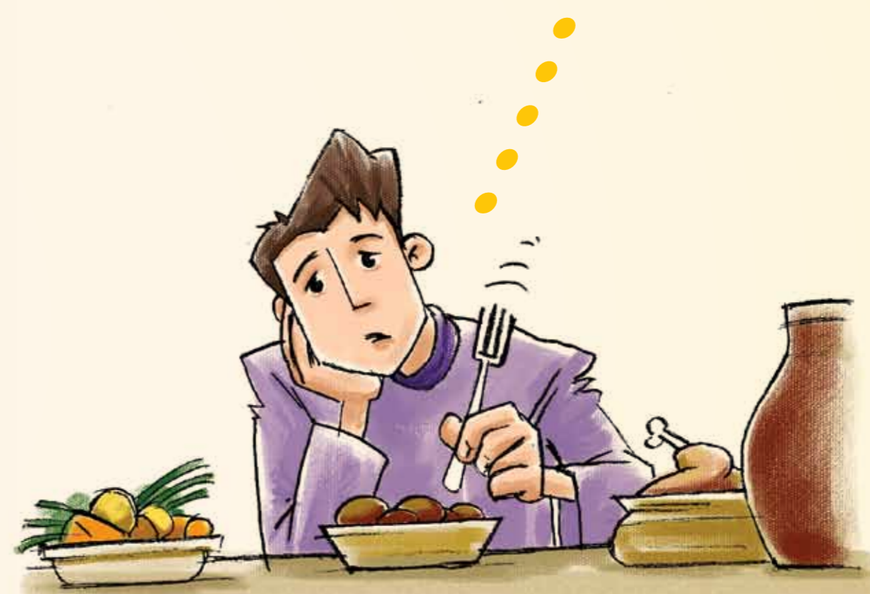
PIERDEREA POFTEI DE MÂNCARE

Dacă observați la dumneavoastră sau la rudele dumneavoastră cel puțin unul dintre simptomele tuberculozei, adresați-vă urgent la medicul de familie. Medicul vă va examina și, la necesitate, va dispune trimiterea Dumneavoastră pentru examinări la ftiziopneumolog. Numai specialistul poate prescrie un tratament adecvat.