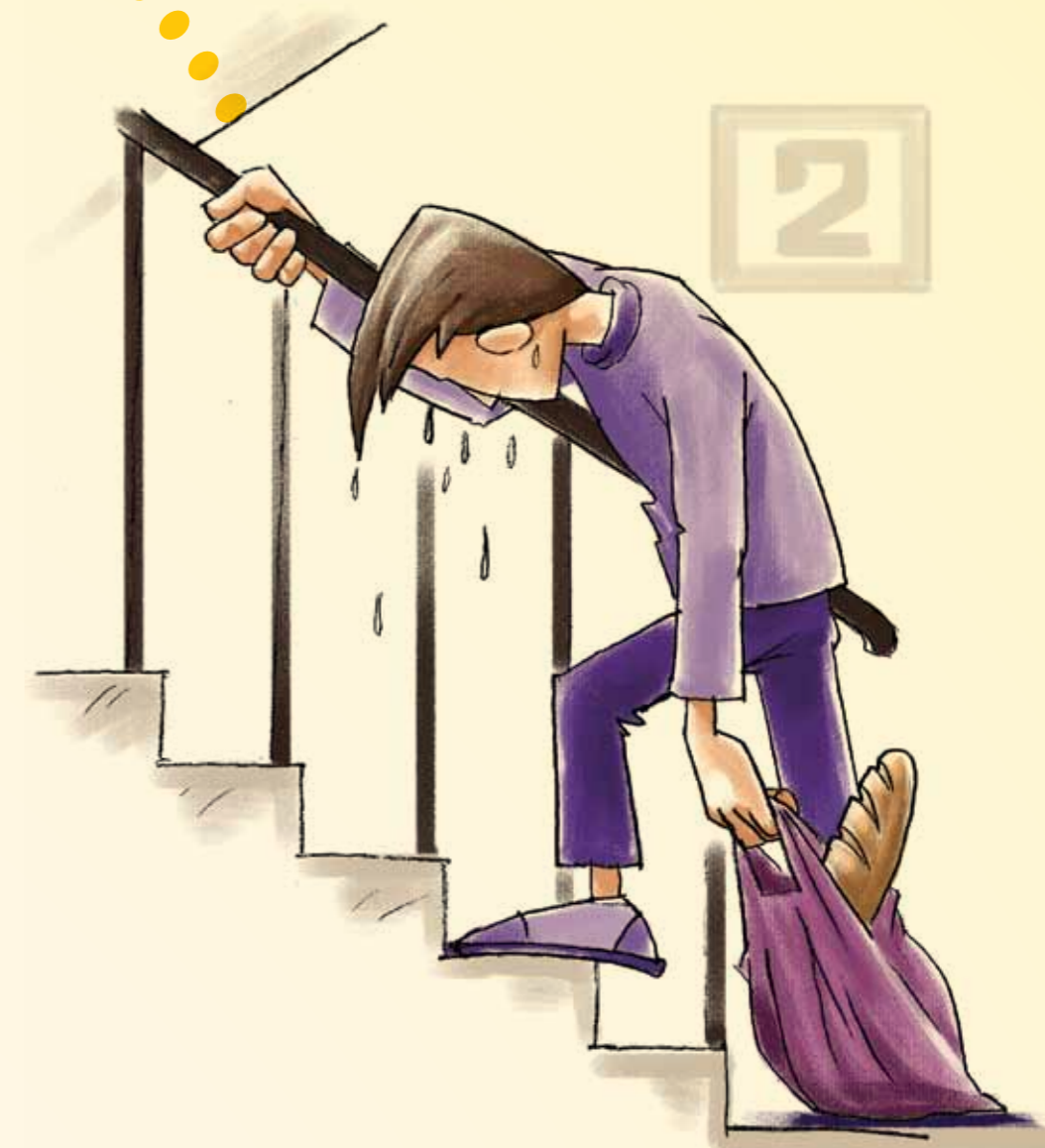
ASTENIE PERMANENTĂ, OBOSEALĂ

temperatura corpului este cu 1-2 grade mai mare ca de obicei timp de o săptămână fără o cauză evidentă, frisoane